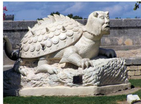
La Tarasque à Tarascon