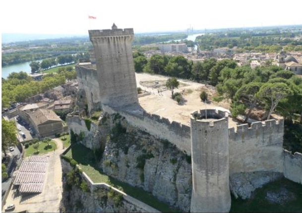
Forteresse de Beaucaire

Puis nous filons au pied de la forteresse de Beaucaire, rejoindre Séverine Ines Guehl médiatrice culturelle à la Communauté de commune Beaucaire Terre d'Argence.