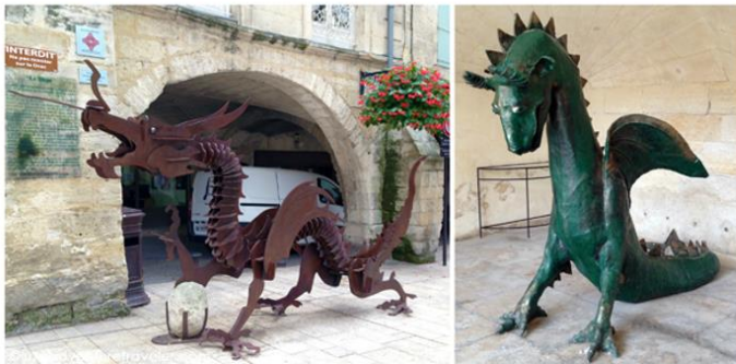
Deux représentations du Drac à Beaucaire

Elle évoque l'épisode du siège de Beaucaire, nous nous attaquons ensuite à l'ascension de la forteresse, de là-haut, une vue majestueuse sur le fleuve se dévoile. Nous redescendons ensuite dans les ruelles de la cité médiévale... nous y croisons un monstre légendaire : c'est le Drac, dragon emblématique de la ville. La visite de Beaucaire se termine au CIAP, centre d'interprétation d'architecture et du patrimoine qui présente l'histoire de la ville et notamment l'épisode de la Foire de Beaucaire grand marché commercial qui fera la renommée de la ville à au 17 ème siècle.