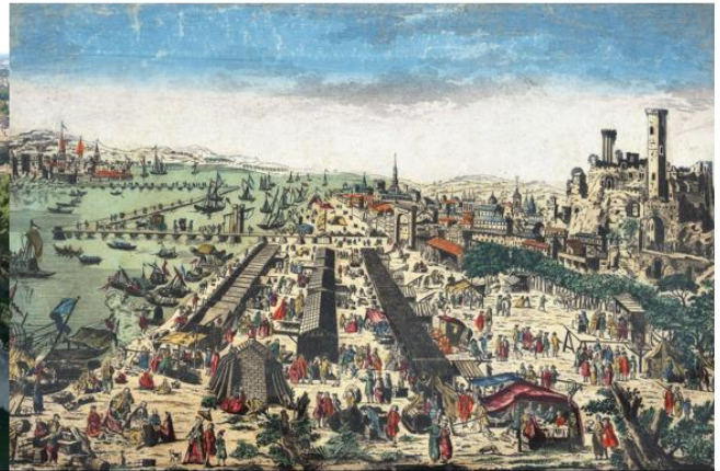
Beaucaire au temps de la Foire

Elle évoque l'épisode du siège de Beaucaire, nous nous attaquons ensuite à l'ascension de la forteresse, de là-haut, une vue majestueuse sur le fleuve se dévoile. Nous redescendons ensuite dans les ruelles de la cité médiévale... nous y croisons un monstre légendaire : c'est le Drac, dragon emblématique de la ville. La visite de Beaucaire se termine au CIAP, centre d'interprétation d'architecture et du patrimoine qui présente l'histoire de la ville et notamment l'épisode de la Foire de Beaucaire grand marché commercial qui fera la renommée de la ville à au 17 ème siècle.